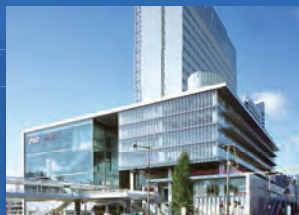
ANAクラウンプラザホテル岡山