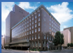
札幌グランドホテル