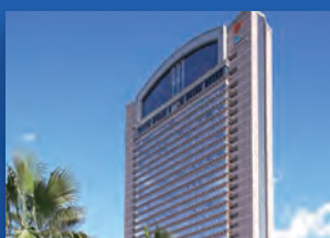
ホテル京阪ユニバーサルタワー