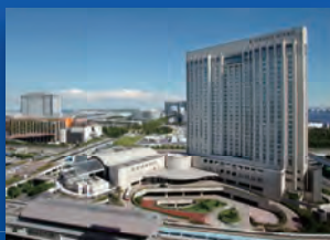
グランドニッコー東京台場