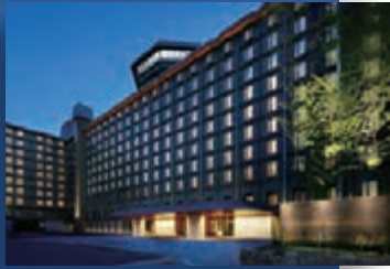
近畿(京都) / リーガロイヤルホテル京都