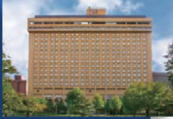
中部(名古屋) / 名古屋観光ホテル