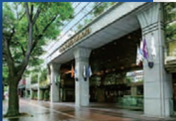
九州(福岡) / ホテル日航福岡