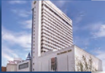
東北(仙台) / ホテルメトロポリタン仙台