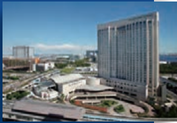
関東(東京) / グランドニッコー東京台場