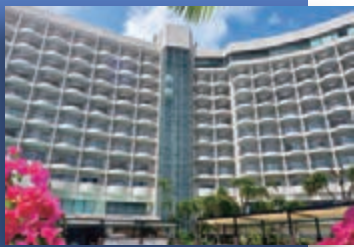
沖縄(那覇) / ロワジールホテル&スパタワー那覇