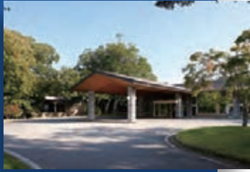
上信越(軽井沢) / 軽井沢プリンスホテル