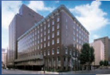
北海道(札幌) / 札幌グランドホテル