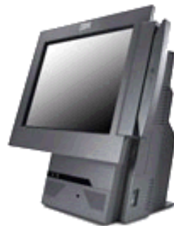
IBM SurePOS 500シリーズ